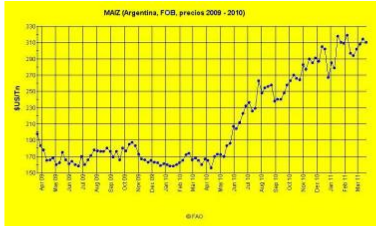
Figura 2: Precios de maíz entre 2009 y 2011