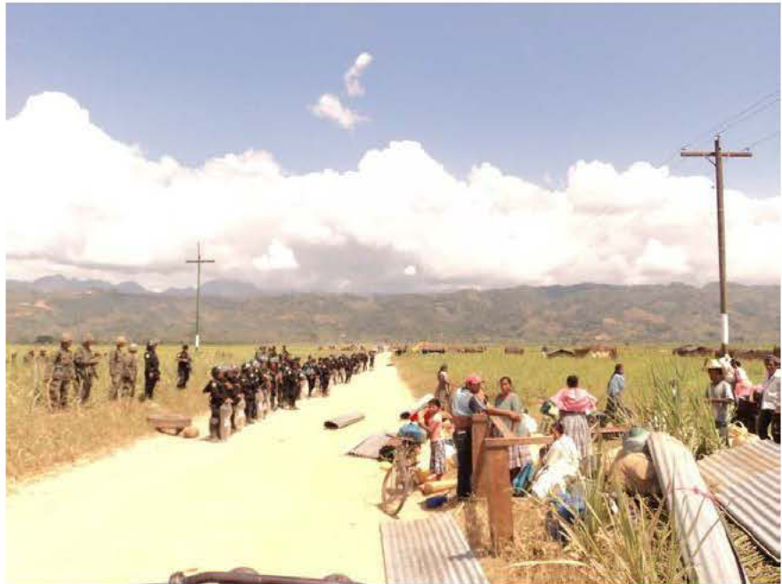
Miralvalle, Valle de Polochic, Guatemala, 15 de marzo de 2011. La comunidad fue expulsada, y sus casas y cultivos destruidos.

La nueva oleada de acuerdos sobre tierras no es la inversión en agricultura que millones de personas esperaban. Las personas más pobres son quienes más sufren cuando se intensifica la competencia por la tierra. Las investigaciones de Oxfam demuestran que la población local suele salir perdiendo frente a las élites locales y a los inversores nacionales o extranjeros, ya que carece de poder para hacer valer sus derechos y defender sus intereses eficazmente. Las empresas y los gobiernos deben adoptar urgentemente medidas para que se respete el derecho a la tierra de las personas que viven en la pobreza. Además, si se espera que las inversiones contribuyan a mejorar la seguridad alimentaria y los medios de subsistencia de las personas en lugar de minarlos, las relaciones de poder entre los inversores y las comunidades locales tienen que cambiar.