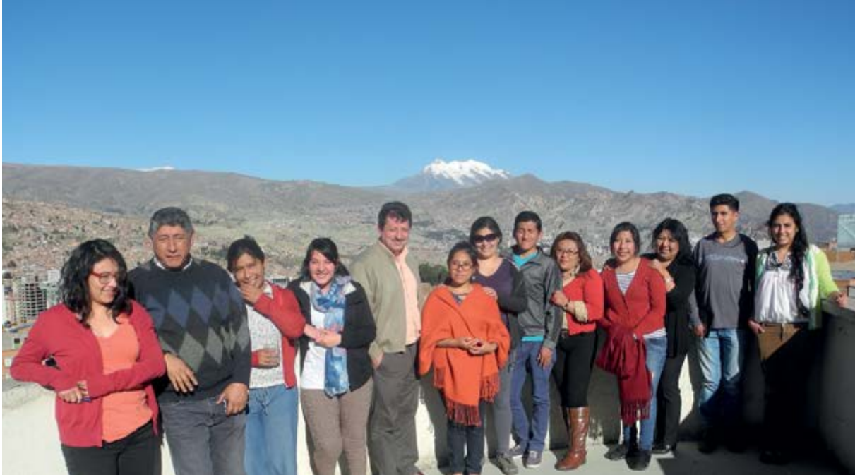
Equipo IPDRS 2017

La misión del IPDRS es contribuir a mejorar las condiciones teóricas, políticas y técnicas para el desarrollo rural en Sudamérica. El IPDRS se asume como una institución de facilitación, complementaria a las estructuras institucionales disponibles en los países de la región. Desde esa posición se empeña en demostrar que el desarrollo rural de base campesina, indígena y afrodescendiente es un asunto de extrema importancia, actual y futura, para los países sudamericanos; que las poblaciones rurales producen un bien social insustituible y, por tanto, las categorías de información, conocimiento, análisis y formulación de propuestas y agendas requieren de una urgente y permanente renovación.