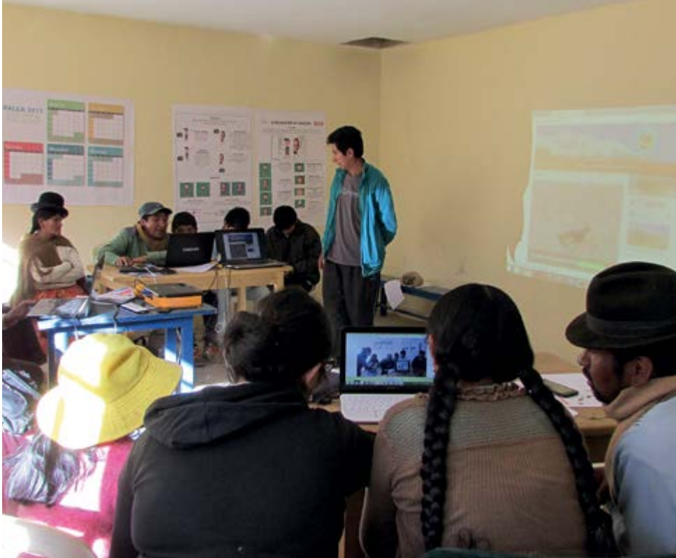
Taller de comunicación digital en Territorios de Interaprendizaje.