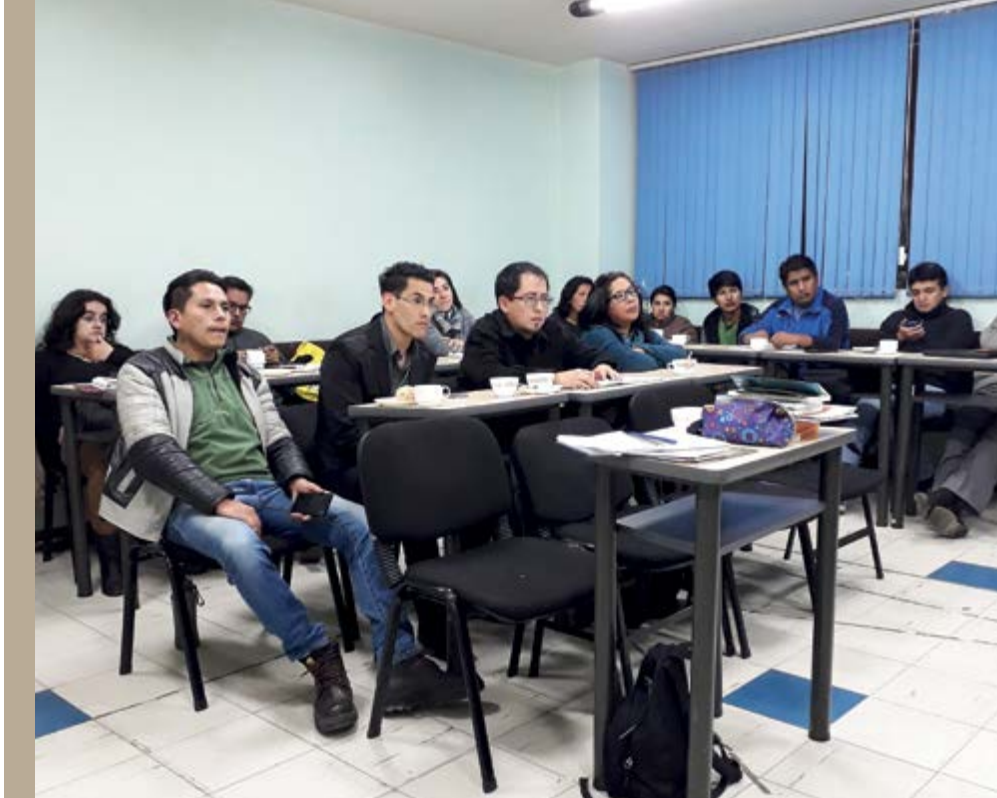
Curso de especialización Administración de Territorios Inteligentes, GAMLP-IPDRS.