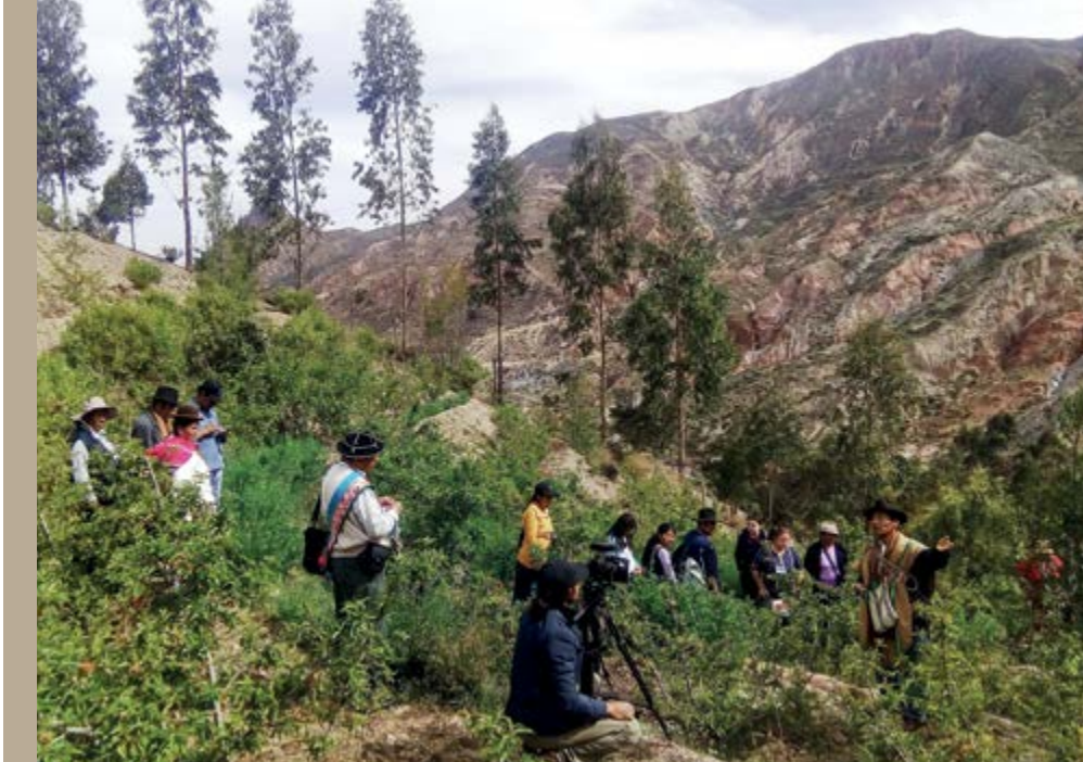
V Encuentro del Movimiento Regional por la Tierra en Huacacampa. (La Paz - Bolivia)