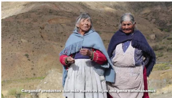
Cargando productos con más nuestros hijos una pena caminabamos