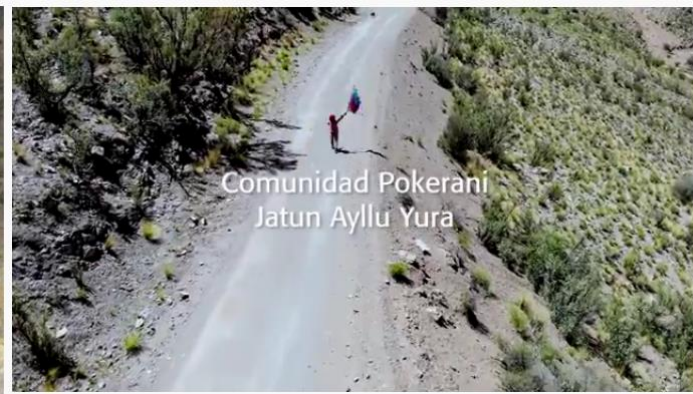
Comunidad Pokerani Jatun Ayllu Yura

BAJO EL ABRIGO DE LAS MONTAÑAS | TESTIMONIOS DE LA MINA CARACOTA