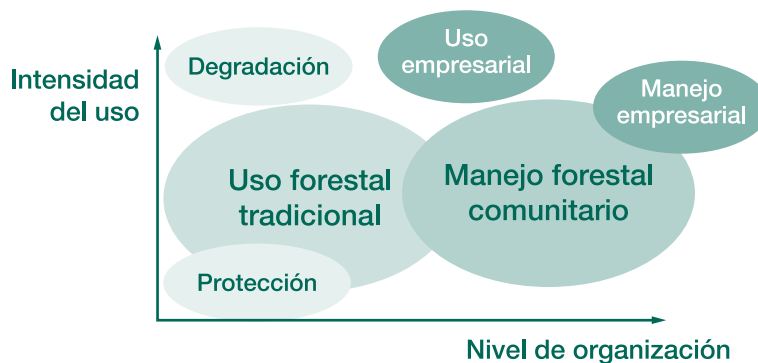
Figura 1-1. Representación del uso forestal con dos gradientes: intensidad de uso y nivel de organización

actores involucrados en el proceso de producción forestal. El nivel de verticalidad abarca esquemas que van desde lo individual hasta organizaciones complejas, como asociaciones o cooperativas y en la forma más sofisticada, empresas; relacionado con ello está la inversión de capital. Como se pretende visualizar en la figura, la forma como se ha promovido el manejo forestal comunitario en América tropical, a pesar de incluir una gama muy amplia de modalidades, tiene un énfasis en los niveles más intensivos del uso forestal y supuestamente los más organizados.