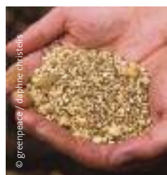
Ración para ganado lechero.