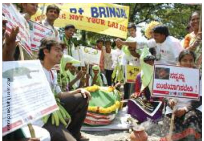
Acción contra la berenjena Bt, India.