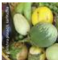
Diversidad de berenjenas.

Agricultores y comunidades locales también han expresado su rechazo a los cultivos transgénicos en varias regiones de Uruguay, como en el Departamento de Montevideo donde se dispuso una medida precautoria sobre los cultivos transgénicos. Además, en la provincia de Santa Fe, Argentina, pobladores locales afectados negativamente por la aplicación aérea de glifosato (Roundup) sobre cultivos de soja transgénica, ganaron un juicio que prohíbe el uso de Roundup y otros agroquímicos cerca de viviendas y centros poblados.