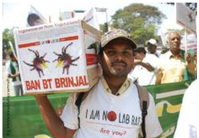
Llevando peticiones contra la berenjena Bt.