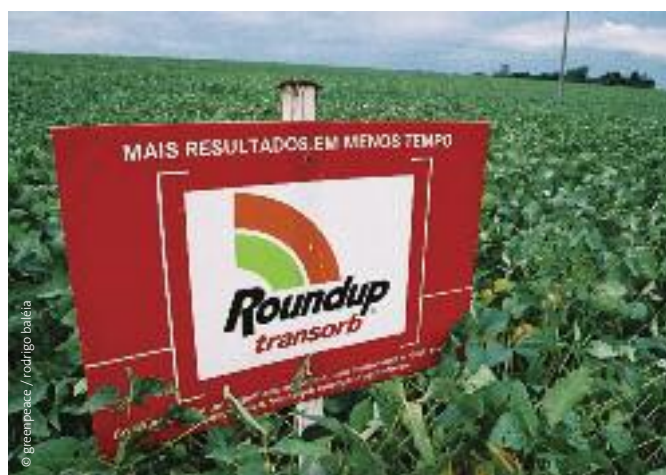
Campos de soja con publicidad de Roundup Transorb, un herbicida producido por la empresa estadounidense Monsanto, Rio Grande do Sul, Brasil.

Desde 2007, las organizaciones de la sociedad civil han denunciado que la CTNBio bloquea el acceso a los procedimientos de liberación, violando el derecho a la información. Esta decisión judicial refuerza la posición crítica de estas organizaciones respecto a la actuación de la CTNBio al autorizar los cultivos transgénicos. 79