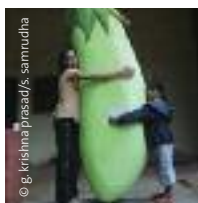
Niños abrazando una berenjena, India.

Aunque la producción de berenjenas libres de transgénicos hoy está salvaguardada, hay ensayos de campo para muchos otros cultivos alimentarios transgénicos que prosiguen incólumes. Sólo en 2010, se concedieron permisos para ensayos con 12 cultivos alimentarios transgénicos (y para múltiples eventos por cada cultivo), entre ellos para productos básicos como el arroz, maíz y sorgo; verduras como el tomate, la coliflor, la berenjena y el repollo; frutas como el melón y la papaya; y caña de azúcar, mostaza y maní. 164