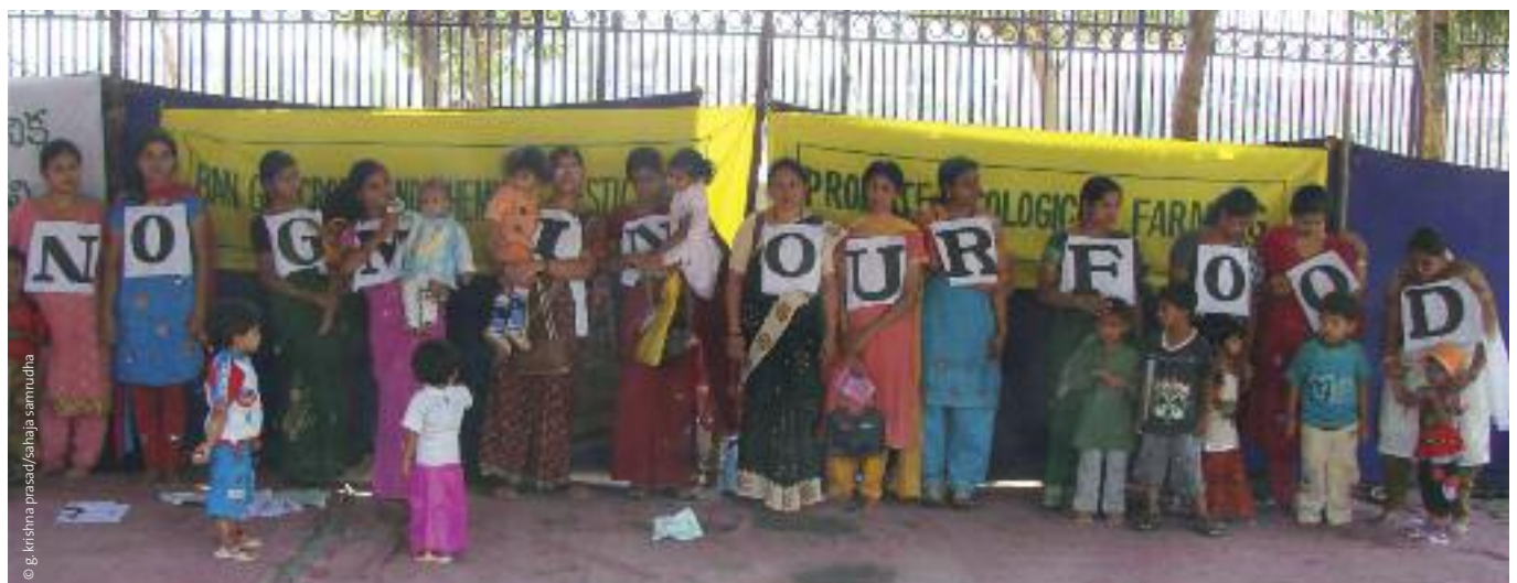
Madres contra los alimentos transgénicos, India.